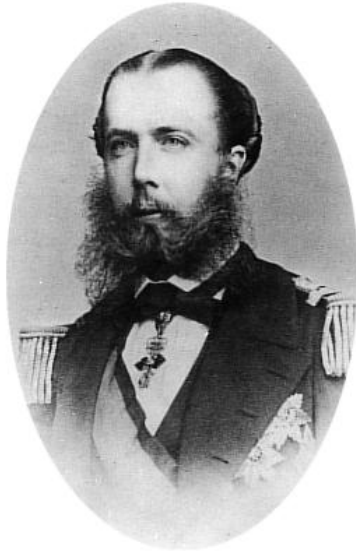
Kaiser Maximilian von Mexiko, Bruder von Kaiser Franz-Joseph von Österreich

Mexiko weigert sich, Schulden zurückzuzahlen, die Kaiser Maximilian zwischen 1863 und 1867 mit wucherhaften Zinsen aufgenommen hatte, um seine Macht über das Land zu sichern.