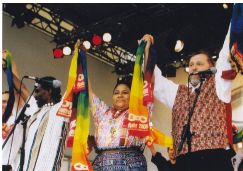
Unsere These: Wir hätten bereits früher mit den entschuldeten Ländern feiern können - und die Gläubiger hätten dabei Geld gespart