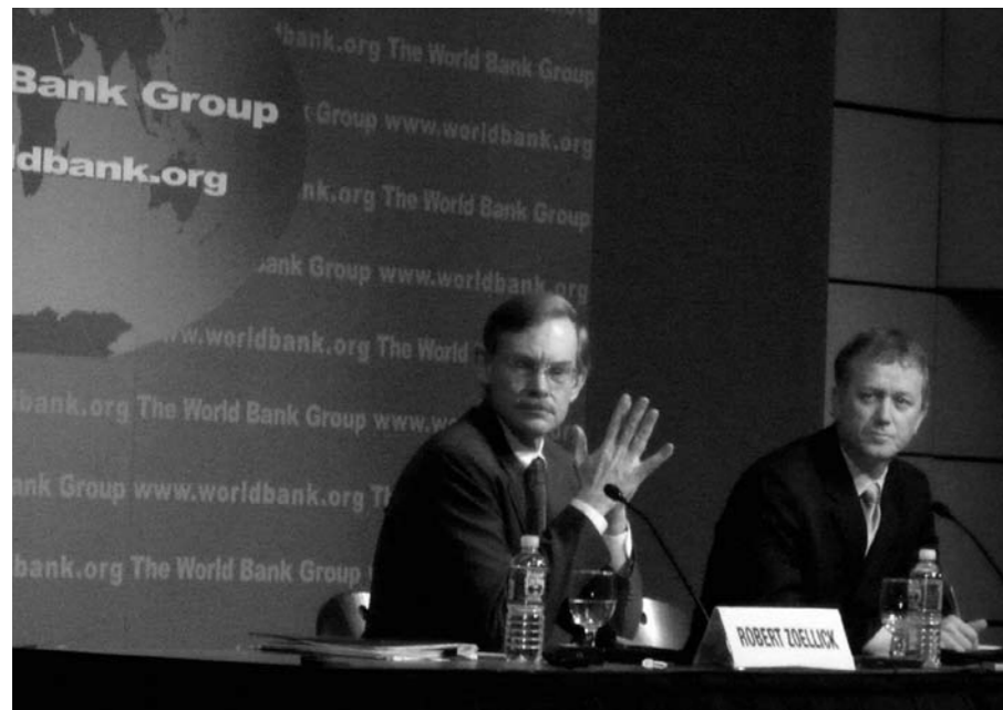
Würden Sie diesem Mann eine Armutsbekämpfungsstrategie abkaufen? Weltbank-Präsident Robert Zoellick

unterschiedlichen Programmen verschiedener Parteien wählen konnten. Wer auch immer an die Regierung kam, musste den Weltbank/IWF-Politikvorgaben folgen. Die große Gefahr einer neuen Schuldenkrise, die im Zusammenhang mit gegenwärtig über 3 Billionen US Dollar Währungsreserven auf der Welt gerade den rohstoffreichen afrikanischen Ländern droht, werden nicht beachtet. Auch die völlig undemokratische interne Machtverteilung der Weltbank ist nach wie vor problematisch. Die Rolle der neuen Kreditgeber wie China und Indien werden übergangen. Am krassen ist die Lücke zwischen Zoellicks Rhetorik und der Realität bei der Landwirtschaft. Gerade hat die Evaluierungsabteilung der Weltbank einen Bericht veröffentlicht, der der Tätigkeit der Weltbank in der Landwirtschaft in Afrika in den letzten 20 Jahren ein verheerend schlechtes Zeugnis ausstellt.