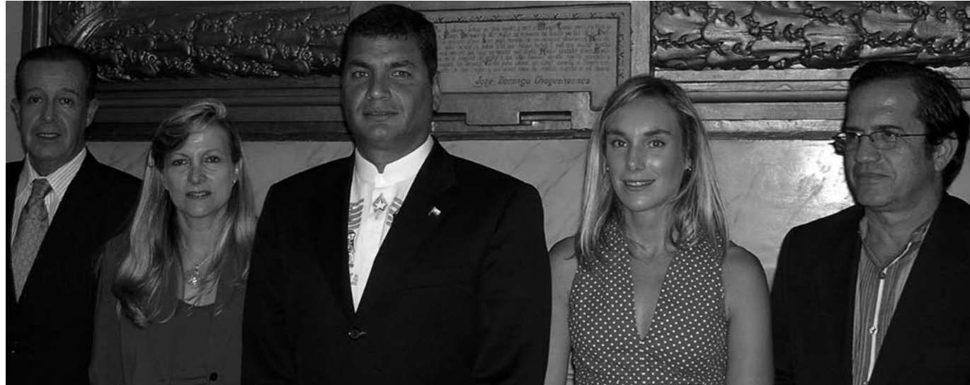
Foto: Mitglieder der Kommission mit Präsident Correa (mitte) und Finanzminister Ricardo Patiño (rechts)

erlassjahr.de in der offiziellen „Auditoria“-Kommission der ecuadorianischen Regierung