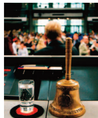
Plenarsaal Bundestag

Wie die Fraktion schreibt, hat die weltweite Wirtschaftskrise die globale Verschuldungssituation weiter verschärft. Daher werde die Reform der internationalen Prozesse zur Bewältigung staatlicher Schuldenprobleme immer dringlicher. „Die aktuelle Europäische Schuldenkrise hat zudem deutlich gemacht, dass die Gefahr einer Staats-Überschuldung bis hin zur faktischen Insolvenz nicht nur hoch verschuldete Entwicklungsländern besteht“, so die Fraktion.