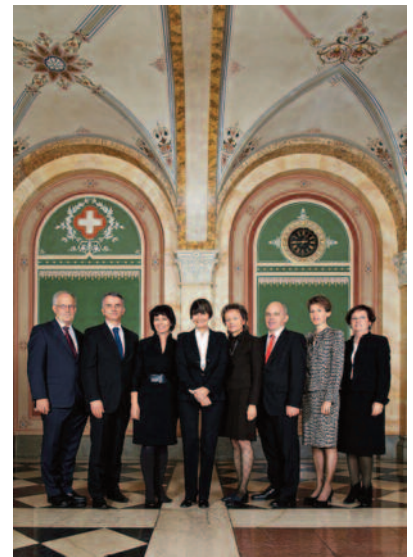
Schweizer Bundesrat 2011

Die Organisationen fordern nun eine rasche Einlösung dieses Versprechens. Nur wenn alle Schulden berücksichtigt werden, kann die Schuldensituation eines Landes umfassend beurteilt und nachhaltig geregelt werden. Und nur so kann eine Ungleichbehandlung der Gläubiger vermieden werden.